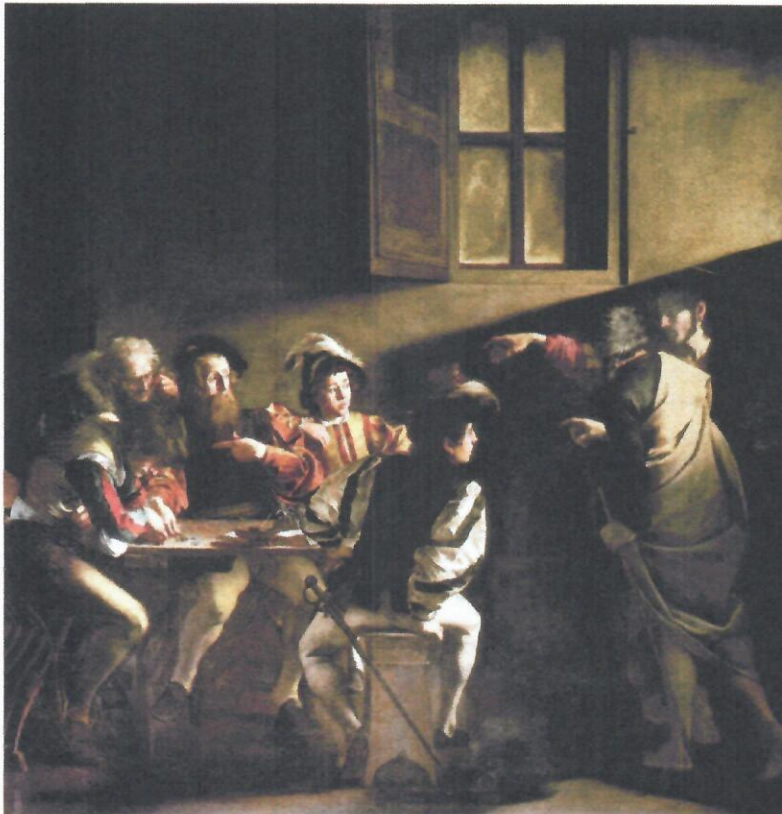
St. Matthew's Calling by Christ by Caravaggio.

por Caravaggio, 1599-1600, ubicado en la Capilla Contarelli en la Iglesia de San Luis Rey de Francia, Roma, Italia.