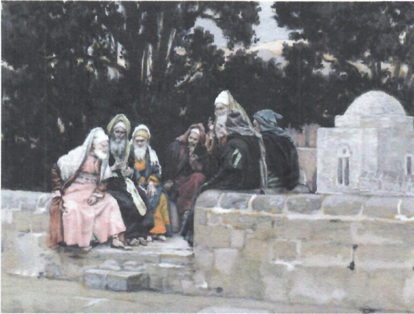
Pharisees and Herodians conspire against Jesus by Tissot

En Marcos 2,23-28, una vez más vemos a los fariseos al acecho, buscando cualquier posible violación de la ley para que puedan acusar a Jesús y sus seguidores. Esta vez, Jesús y sus discípulos están cruzando un campo de grano maduro aparentemente apurados por llegar a la próxima ciudad. Aunque los discípulos están hambrientos, no se detienen a comer, por lo que los discípulos arrancan parte del fruto maduro para calmar su apetito. Por lo general, se permite que un viajero