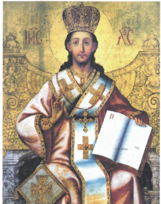
Christ enthroned as King by Vasilievic. © Restored Traditions. Used by permission.

Después de su bautismo en el río Jordán y cuarenta días en el desierto, Jesús regresa a Galilea, donde reunirá a doce hombres a su alrededor como sus discípulos más cercanos. El relato de San Marcos sobre el llamado de Pedro (Simón), Andrés, Santiago y Juan es dramático y se centra en el poder y la autoridad divinos con los que Cristo llama a sus apóstoles. Veremos como San Marcos continúa estableciendo las bases para afirmar que Jesús es el tan esperado Mesías y cómo Jesús proclama la inauguración del Reino de Dios en la tierra a través de sus poderosas obras. Jesús es el nuevo Moisés, liderando a la gente en un éxodo de sus pecados, pero enfrentando la oposición de un nuevo faraón, los escribas y los fariseos. Finalmente consideraremos la autoridad de Jesús: su fuente, cómo se manifiesta y las diversas respuestas de las personas que lo rodean. Cuando Jesús comienza a revelar la plenitud de su autoridad divina y el alcance de su mandato, muchos se sienten atraídos a él; sin embargo, las autoridades religiosas se indignan cada vez más al darse cuenta de que Jesús afirma ser Dios.