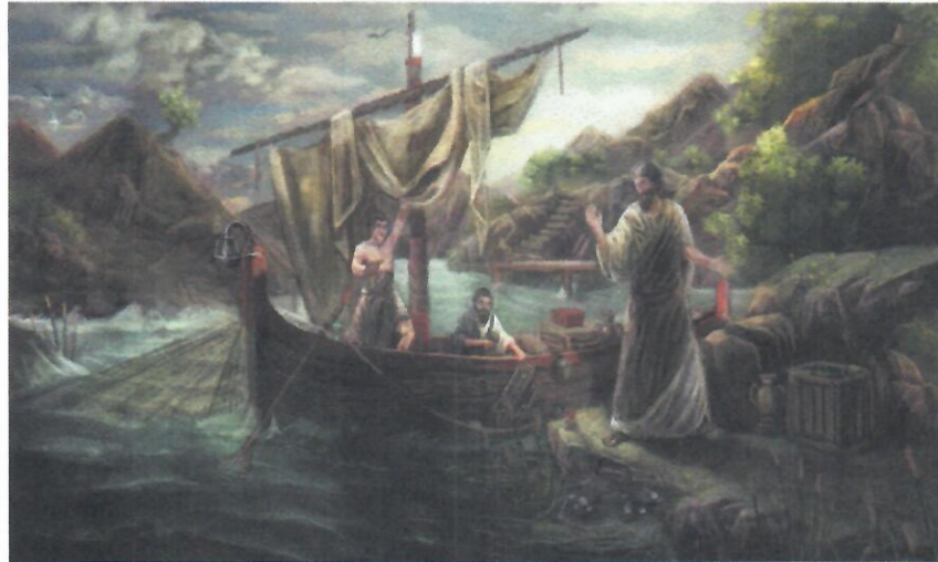
Christ calling the apostles James and John

Después de su bautismo en el Jordán y cuarenta días en el desierto, Jesús regresa a Galilea, dando el siguiente paso para su misión. En el Mar de Galilea, llama a varios pescadores para que lo sigan, Pedro (Simón), Andrés, Santiago y Juan. De este primer encuentro con Jesús, San Marcos da un relato dramático. Jesús pasa e inmediatamente lo siguen.