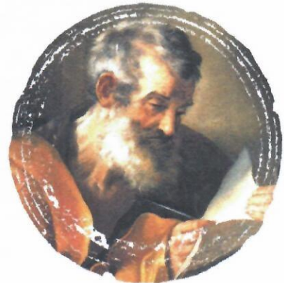
Saint Mark by Reni. © Restored Traditions. Used by permission.

—Oración para conocer la vocación individual – USCCB