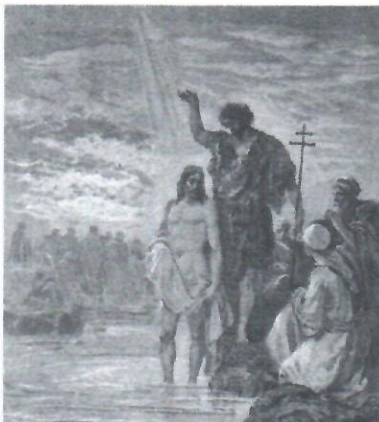
John the Baptist preaches in the wilderness

La lectura de ayer fue sobre el inicio de la predicación de Jesús. Hoy retrocedemos un poco para enfocarnos en el Bautismo de Jesús. Es interesante que cuando Jesús llega al Jordán, aparece como uno de la multitud (ver Marcos 1,5). La muchedumbre pudo haber salido inicialmente debido a la curiosidad, queriendo ver al profeta moderno, que se vistió como el profeta Elías de antaño (ver 2 Reyes 1,8), y que predicó ardientes sermones. Busca Lucas 3,8 y 3,10-14. ¿Qué advertencia le hace San Juan Bautista al pueblo? ¿Cómo le dice a la gente que debe de vivir?