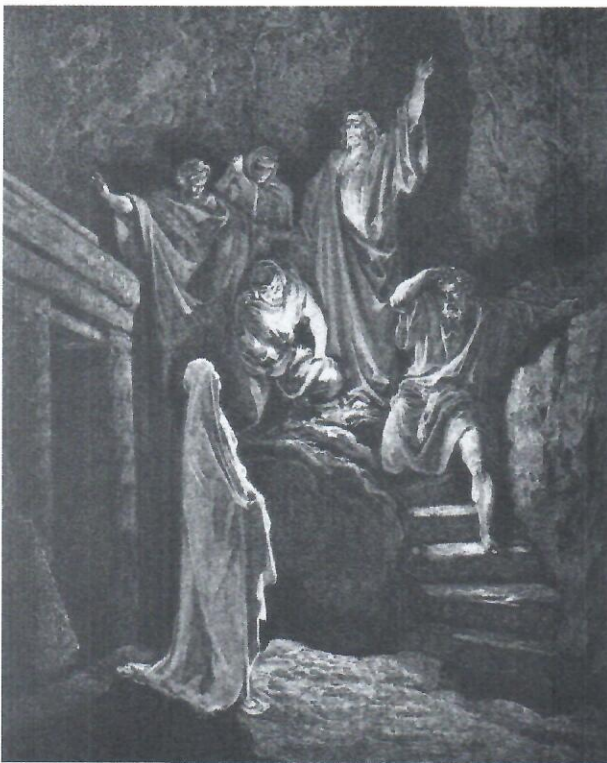
The Raising of Lazarus by Gustave Dore

En su evangelio, Marcos muestra que Cristo continúa la obra de Dios como su hijo fiel. Él introduce el reino de la misericordia con señales y milagros, culminando sus poderosas obras en la Cruz. Cristo, el Hijo de Dios, inauguraré una nueva creación, perdonará los pecados, sanará a los ciegos, a los sordos, y hará que todo sea nuevo. Él comparte la obra de amor del Padre, restaurando al hombre y llevándolo a la bendición. A pesar del odio de aquellos que lo rechazan, Cristo permanece fiel y se convierte en una fuente de bendición para sus hermanos.