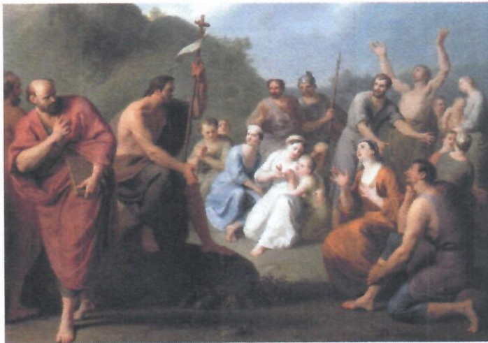
St. John the Baptist Preaching by Favanne

Habiendo declarado la divinidad de Jesús en su primer verso, San Marcos nos prepara para Jesús y su ministerio al combinar tres pasajes diferentes del Antiguo Testamento. Marcos se basa en dos profetas, Isaías (40,2-3) y Malaquías (3,1), y del Libro de Éxodo (23,20). Aquí hay una comparación que incluye el texto de Marcos y los tres pasajes del Antiguo Testamento.