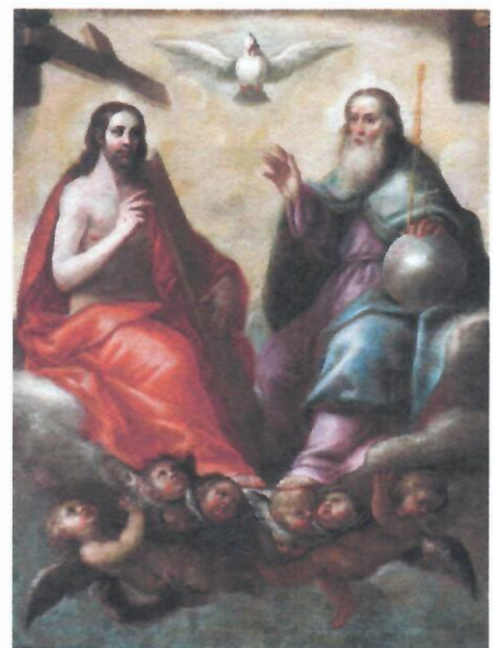
The Holy Trinity by Anon-18c

Después de que su padre, Julio César, fuera asesinado por el senado romano, Augusto llegó al poder y persuadió al senado de proclamar póstumamente a su padre como una deidad. Con Julio César ahora como un dios, Augusto pasa a ser un hijo de dios, la divinidad misma. Augusto tenía monedas acuñadas con su nuevo título. Rápidamente el culto imperial se hizo prominente y los templos dedicados a Augusto se podían encontrar en lugares de todo el imperio, incluso tan lejos como Palestina. Herodes el Grande dedicó tres ciudades en honor de César Augusto, y en una de ellas, Cesárea de Filipo, le dedicó un templo de mármol blanco.