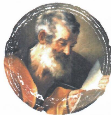
Saint Mark by Reni.

Dios Todopoderoso, que te revelas amorosamente a los hombres por medio de hechos y palabras. Te pedimos por intercesión del evangelista San Marcos, que meditando la Buena Nueva del Evangelio sigamos el camino de Jesucristo. Amén.