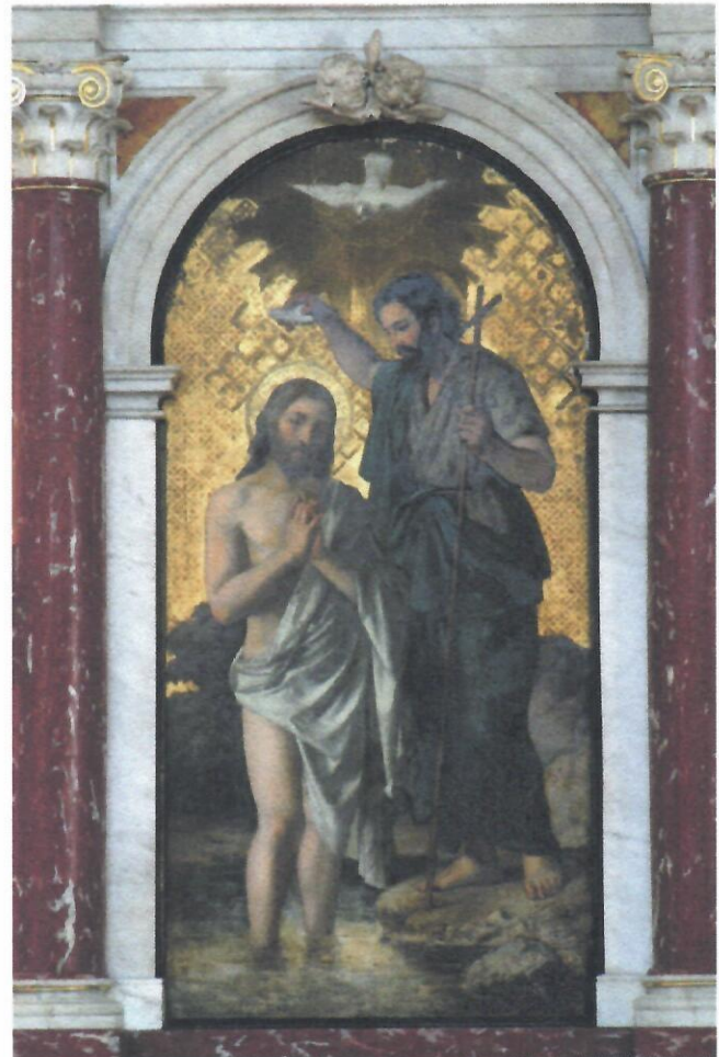
Baptism of the Lord

En la sesión anterior conocimos a San Marcos y conocimos más de cerca su origen y el carácter distintivo de su evangelio. En esta sesión, veremos evidencia textual que confirma la afirmación tradicional de que los escritos de Marcos se basan en el testimonio de Pedro. Luego comenzará el viaje por el texto mismo, y veremos cómo la apertura del Evangelio de San Marcos nos muestra quién es Cristo y por qué ha bajado a la tierra.