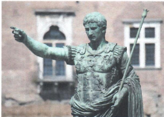
Caesar Augustus in Rome, Italy

A veces, los escritores u oradores usan una estructura cuidadosamente diseñada para presentar su punto principal. A veces simplemente lo dicen desde el principio. ¿Qué manera te atrae más? ¿En qué circunstancias elegirías un enfoque más directo?