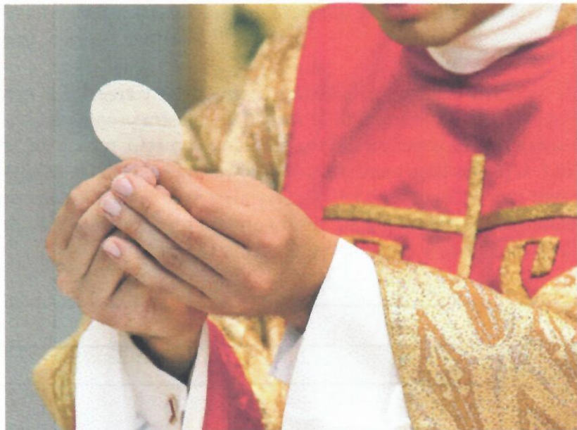
Priest celebrating Mass

En el texto en latín de las palabras de consagración, los sacerdotes dicen: “ Quod pro vobis tradetur ”, que se traduce como “que será entregado”. La palabra tradetur , “abandonado”, proviene del mismo verbo, tradere , como las palabras traditus est , “entregado”.