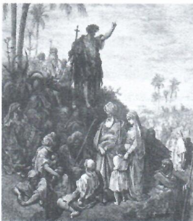
John the Baptist preaches in the wilderness

La conexión entre la predicación y la reforma no es difícil de ver. El mismo San Pablo preguntará retóricamente: “Pero, ¿cómo van a invocar a aquel en quien no han creído? ¿Cómo creerán en aquel de quien no han oído hablar? ¿Cómo van a oír sin que se les predique?” (Ver Romanos 10,14). Pero el siguiente paso, el bautismo, puede parecer menos obvio. Sin embargo, no se menciona ningún cuestionamiento de porqué este próximo paso entre aquellos que se bautizaron.